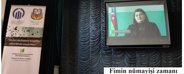
Fimin nümayişi zamanı