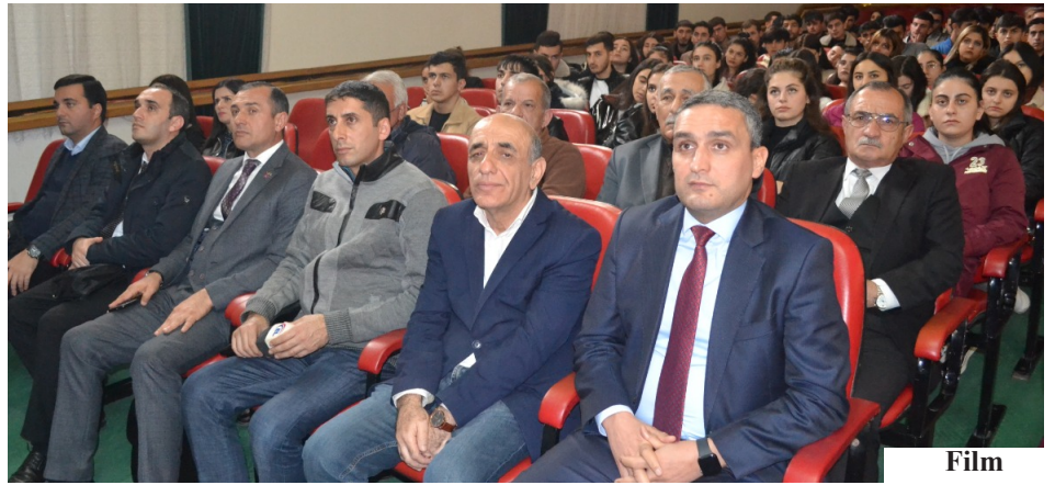
Film izləyənlərin marağına səbəb oldu